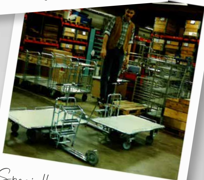
Speciella sparkvagnar 1992