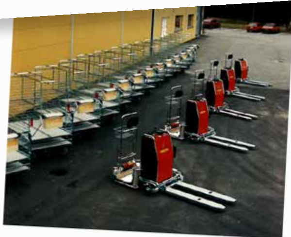
Levernas till postorderföretag 1997