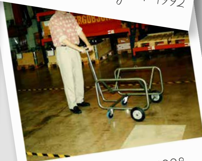
Oljefat svagn 1998